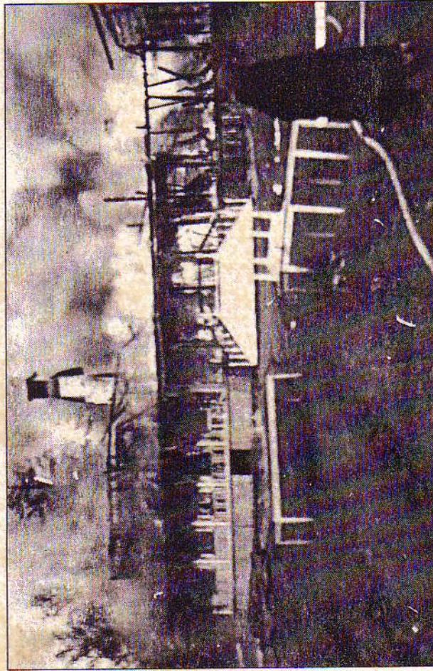
Här en bild från hotellbranden i Källvik, vilken hände för drygt 50 år sedan.